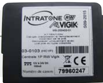
03-0103 Centrale de gestion 1 porte