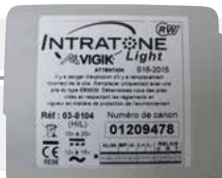
03-0104 Centrale de gestion Light 1 porte